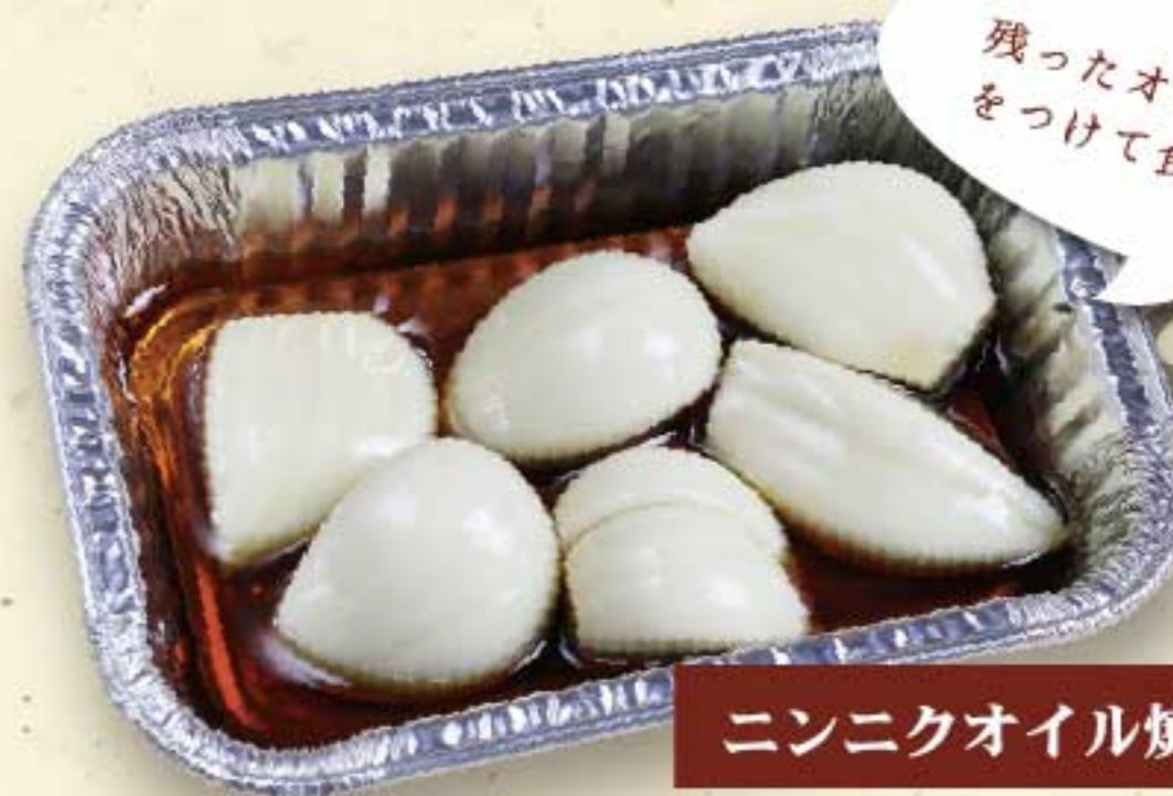
ニンニクオイル焼き 550円