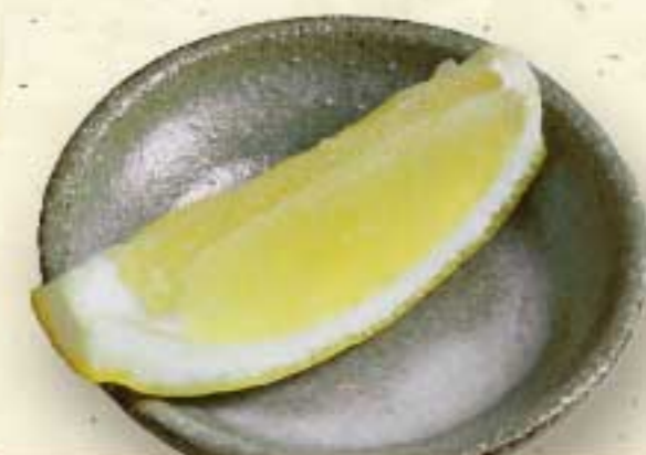
追加カットレモン 30円