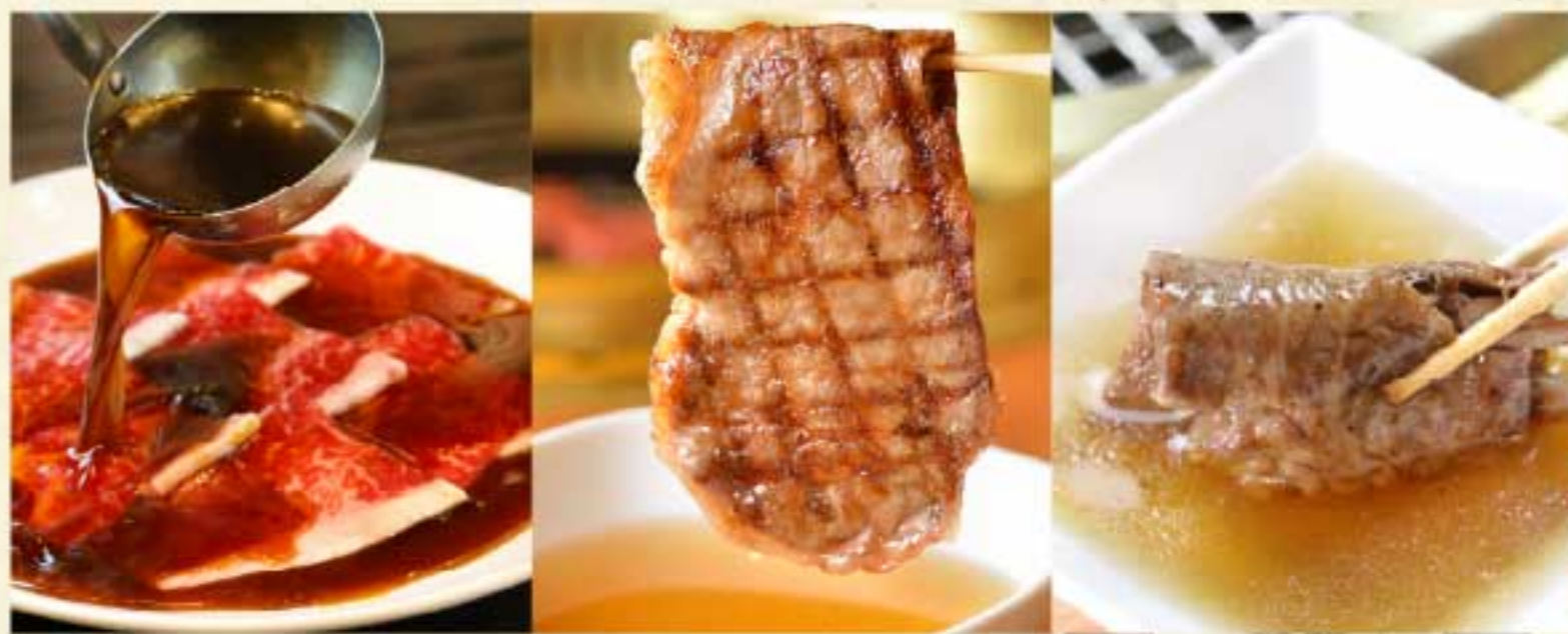
特にロースとの相性が良く人気の「つけたれ」